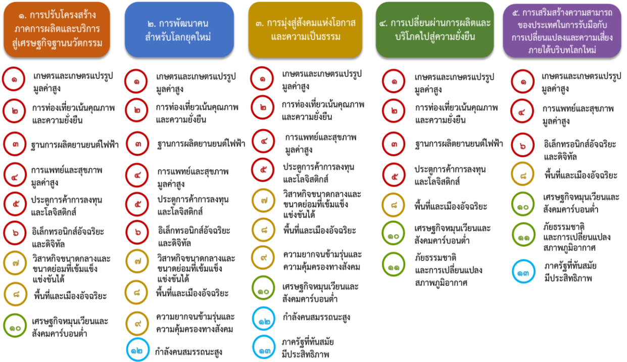
แผนภาพที่ ๓.๑ ความเชื่อมโยงระหว่างหมวดหมายการพัฒนา กับเป้าหมายหลัก

ข้อ นอกจากนี้การพัฒนาภายใต้แต่ละหมวดหมายไม่ได้แยกขาดจากกัน แต่มีการสนับสนุนหรือเอื้อประโยชน์ซึ่งกันและกัน